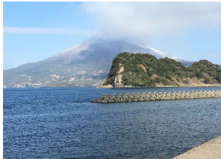
海潟江之島・桜島