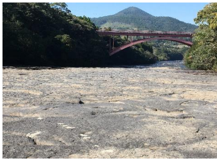
花瀬公園の千畳敷川床