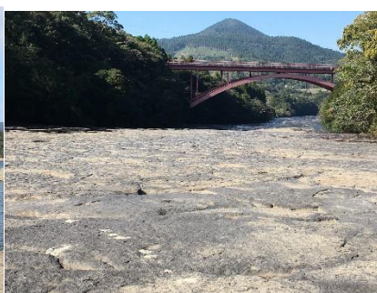
花瀬公園の千畳敷川床