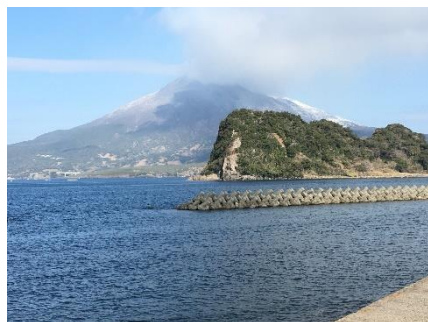
海淵江之島・桜島