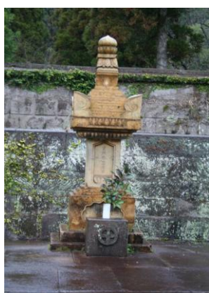
義久の墓(福昌寺跡)