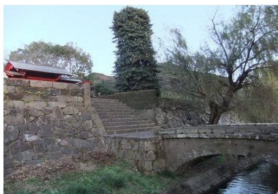
義久晩年の居城舞鶴城址