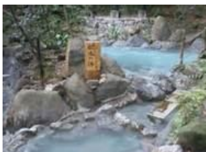
緑溪湯苑(霧島いわさきホテル)