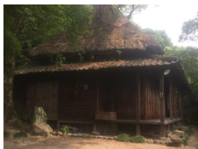
日当山西郷さんの宿（再現）