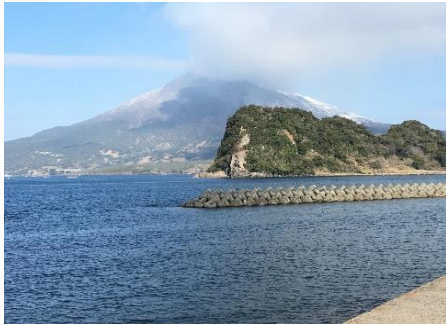
海潟江之島・桜島