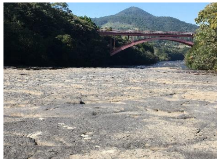
花瀬公園の千畳敷川床