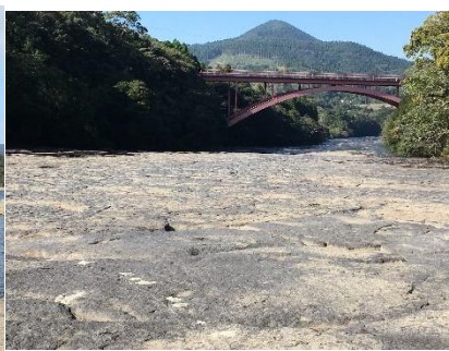
花瀬公園の干畳敷川床